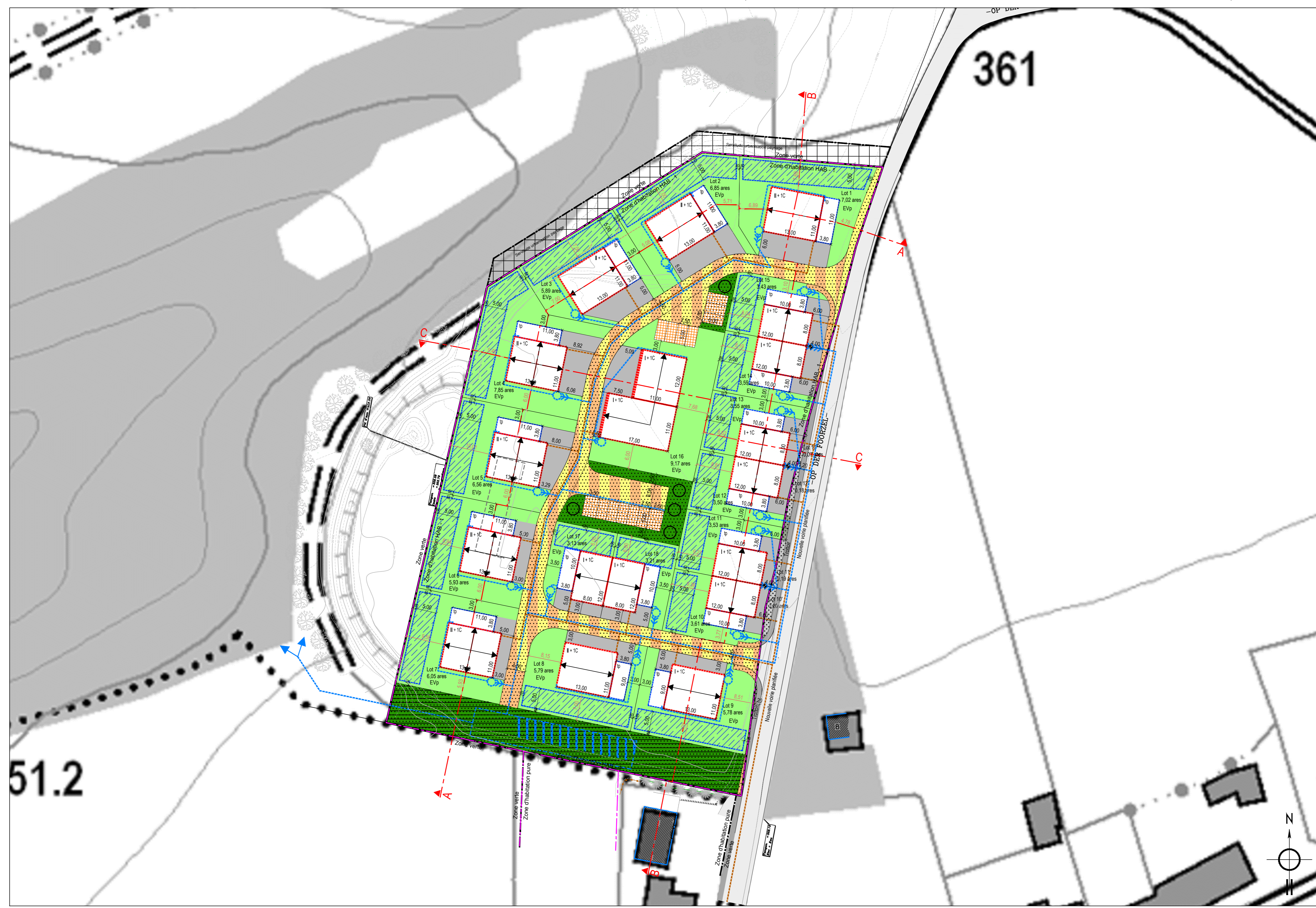
Projet d'Aménagement Particulier 1/500