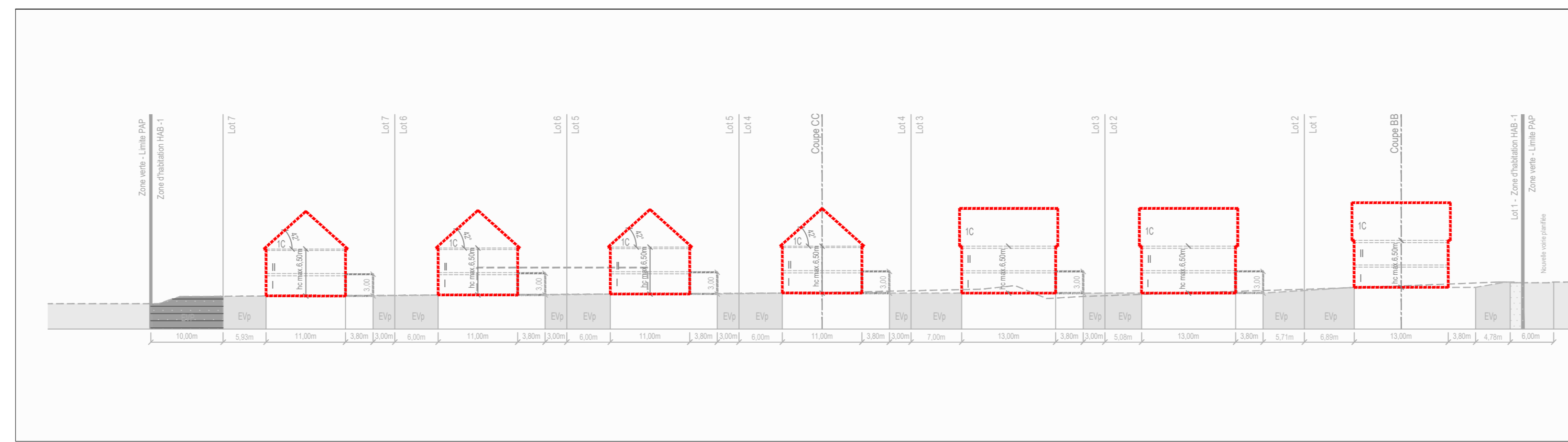
Coupe AA éch. 1/500