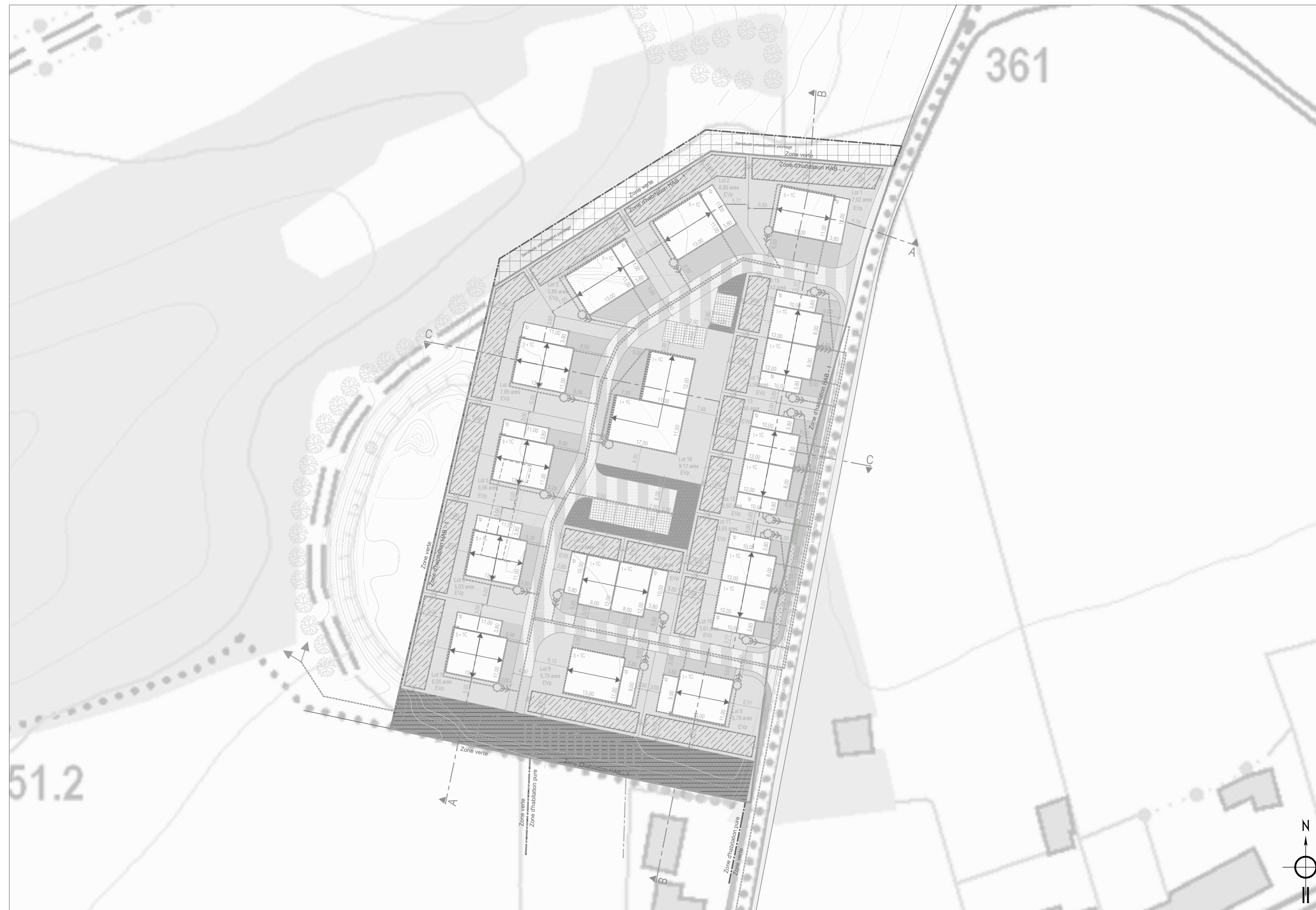
Plan d'Aménagement Particulier 1/500